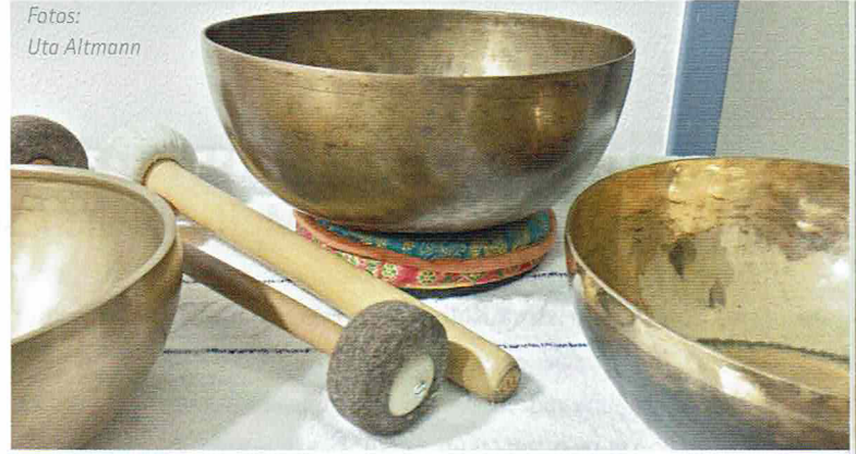
Ein Rollwagen mit Klangmaterial ermöglicht einen flexiblen Einsatz auf der Intensivstation für Früh- und Neugeborene.

Im St. Franziskus-Hospital Münster ist diese Vision schon ein kleines Stück weit Wirklichkeit geworden. Ich bin dem Chefarzt der Neonatologie und Kinderintensivmedizin Dr. Ulrichs sehr dankbar für die Unterstützung und das Vertrauen in meine Klangangebote. Mein ganz besonderer Dank gilt aber vor allem auch dem Pflorgeteam dieser Station. Gerne würde ich mein Klangangebot über die Station hinaus bekannter machen. Hier hoffe ich in der Zukunft auch auf Un-